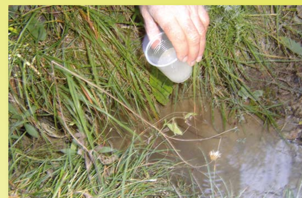
20 octobre 2007 Dégustation d'eau à la source