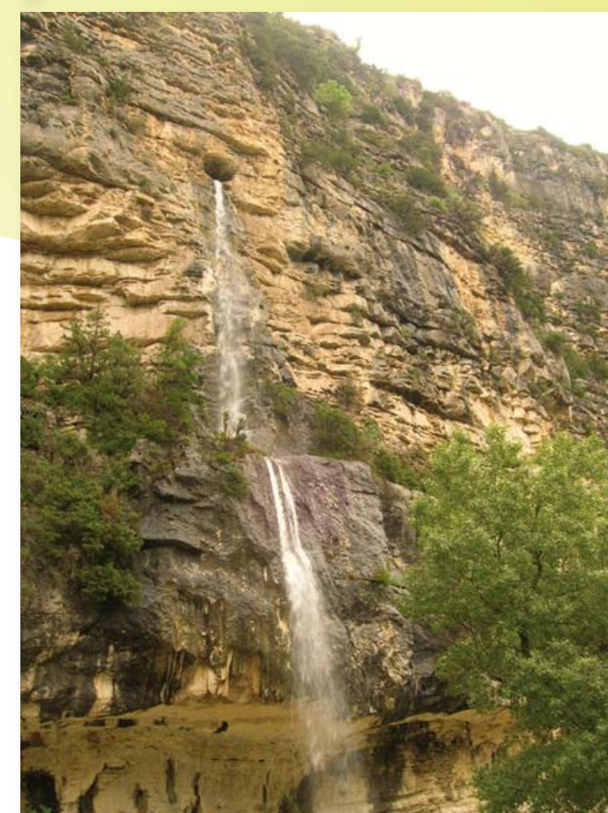
Les Gorges de l'Eygues