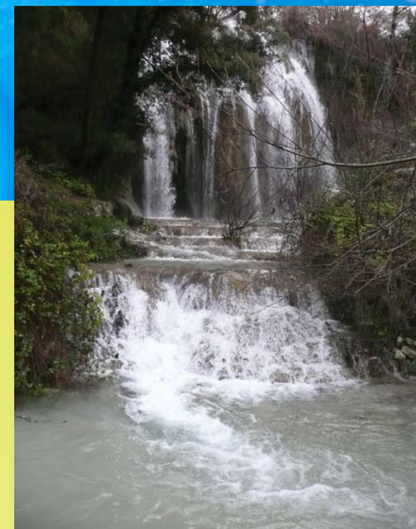
La cascade d'Aubres

Projet Parc naturel régional Baronnies Provençales