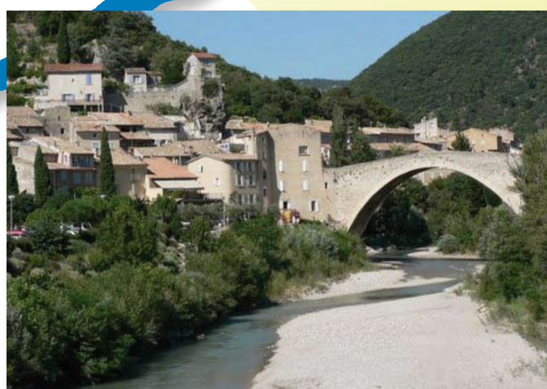
Le Pont Roman de Nyons